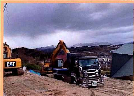
応急対策工事(押さえ盛土、大型土のう設置、土砂搬出)

金沢市による説明会 避難指示エリア世帯を対象に、 1. 避難、復旧工事に関すること 2. 生活支援に関すること 3. 住宅支援に関すること 4. その他(質疑応答等) (R6.1.14)