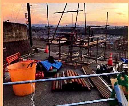
災害復旧工事に向けて「地質調査(ボーリング調査2か所で土採取・土層確認)」