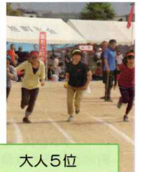
対抗リレー 小学生4位 大人5位