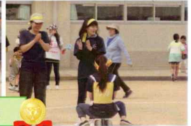
走れコロ丸くん 1位