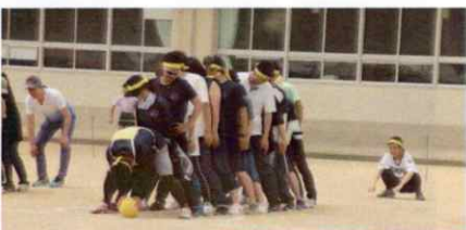
メディンボール 5位