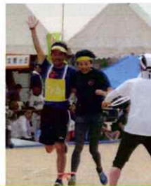
二人三脚リレー 1位